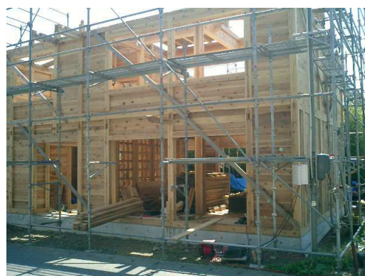
棟上げ間近の伝統木構造による「唐丹小白浜まちづくりセンター」(4月24日)