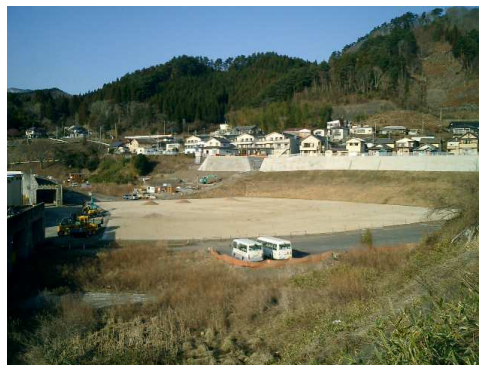
整備された擁壁と低地のグラウンド(2017年3月)