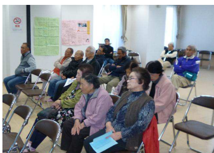
第5回唐丹小白浜意見交換会の様子

昨年10月28日から30日にかけての第5回唐丹小白浜意見交換会では、復興住宅居住者にヒヤリング、「とうにこじらはま まちあるき」(第2版)のための取材、竣工間近の唐丹小中学校の建設現場見学、まちづくりの取り組みの事例紹介、そして最後に公民館で意見交換会という具合に、例年を踏襲する形で、実施することができました。意見交換会で出た「防潮堤かさ上げ工事見直し」については、意見を要望書として取りまとめ、12月に報告書と併せて市に提出することもできました。